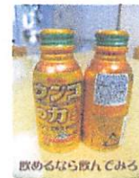
飲めるなら飲んでみる